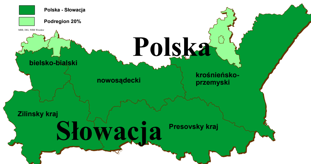
Mapa nr 1 – obszar wsparcia Programu

W powiatach: pszczyńskim, oświęcimskim, rzeszowskim oraz w powiecie grodzkim Rzeszów, projekty będą realizowane zgodnie z art. 21 Rozporządzenia (WE) nr 1080/2006 Parlamentu Europejskiego i Rady z dnia 5 lipca 2006 r. w sprawie Europejskiego Funduszu Rozwoju Regionalnego i uchylającego rozporządzenie (WE) nr 1783/1999 (zwanego dalej Rozporządzeniem (WE) nr 1080/2006) dopuszczającym, w odpowiednio uzasadnionych przypadkach oraz pod warunkiem uzyskania akceptacji PKM Programu, możliwość finansowania wydatków przez partnerów mających siedzibę na obszarach przyległych do zasadniczego obszaru Programu w wysokości do 20% alokowanych na FM środków EFRR. Zasada elastyczności obowiązuje na poziomie całego Programu i będzie monitorowana na poziomie całej alokacji EFRR w ramach wszystkich priorytetów.